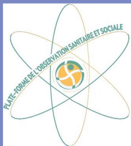
Plate-forme de l'observation sanitaire et sociale d'Auvergne-Rhône-Alpes